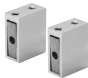
Art. Nr. SERAHW2 höhenverstellbare Adapter für Wandbefestigung (2)