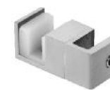
Art. Nr. SERNG2 Bodenführung (1)