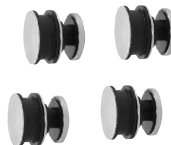
Art. Nr. SERNR1 Rollenführung/ Aushängeschutz Schiebetüre (4)