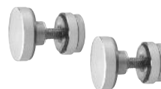
Art. Nr. SERFP2 Glashalter Fixteil / Führungsschiene (2)