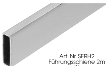
Art. Nr. SERH2 Führungsschiene 2m (1)